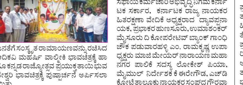
ಜನತೆಗೆ ಸಂಸ್ಕೃತ ರಾಮಾಯಣವನ್ನು ರಚಿಸಿದ ಅದಿಕವಿ ಮಹರ್ಷಿ ವಾಲ್ಮೀಕಿ ಭಾವಚಿತ್ರಕ್ಕೆ ಹಾಗೂ ಕನ್ನಡ ರಾಜ್ಯೋತ್ಸವ ಪ್ರಯುಕ್ತಾಯುಧುವ ನೇಶ್ವರಿ ಭಾವಚಿತ್ರಕ್ಕೆ ಪುಷ್ಪಾರ್ಚನೆ ಅರ್ಪಿಸಲಾಯಿತು.