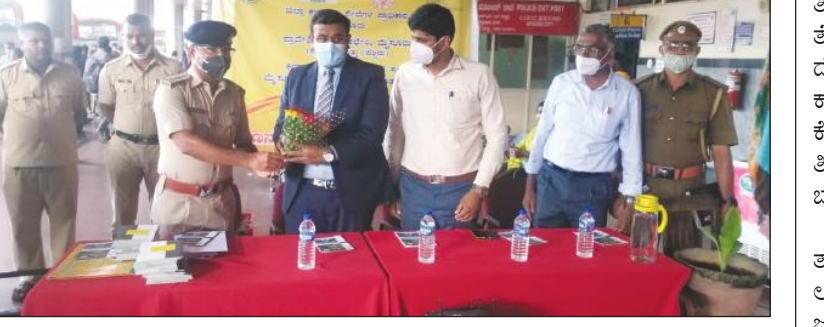
ಗಳನ್ನು ಕಡಿಮೆ ಮಾಡುವ ಗುರಿ ಹೊಂದಿದೆ.

ಅವರು ಮೈಸೂರು ಜಿಲ್ಲಾ ಕಾನೂನು ಸೇವೆಗಳ ಪ್ರಾಧಿಕಾರ ಹಾಗೂ ಕರ್ನಾಟಕ ರಾಜ್ಯ ರಸ್ತೆ ಸಂಸ್ಥೆ ಮೈಸೂರು ನಗರ ಮತ್ತು ಗ್ರಾಮಾಂತರ ವಿಭಾಗ ಇವರ ಸಂಯುಕ್ತ ಆಶ್ರಯದಲ್ಲಿ ನಗರದ ಬಸ್ ನಿಲ್ದಾಣದಲ್ಲಿ ರಸ್ತೆ ಸುರಕ್ಷತೆ ಹಾಗೂ ಕಾನೂನು ಅರಿವು ನೆರವು ಕಾರ್ಯಕ್ರಮವನ್ನು ಉದ್ಘಾಟಿಸಿ ತಿಳಿಸಿದರು. ಈ ನೀತಿಯು ಇಲಾಖೆಯ ಪಾಲುದಾರ ಸಂಸ್ಥೆಗಳಿಗೆ ಮತ್ತು ಸಾರ್ವಜನಿಕರಿಗೆ (ಎ) ರಸ್ತೆ ಬಳಕೆ ದಾರಿಗಳ ಸುರಕ್ಷತೆ ರಸ್ತೆ ಜಾಲವನ್ನು ಒದಗಿಸುವ ದೃಷ್ಟಿಯಿಂದ, ಪಾದಚಾರಿಗಳಿಗೆ ಮತ್ತು ಸೈಕಲ್ ಸವಾರರಿಗೆ ಆದ್ಯತೆ ನೀಡಿ, ಮುಂಬರುವ ದಿನಗಳಲ್ಲಿ ಶೇಕಡ 0% ರಷ್ಟು ಅಪಘಾತಗಳನ್ನು ಸಾಧಿಸಲು ಮತ್ತು (ಬಿ) 2020 ರೊಳಗೆ 25% ರಷ್ಟು ಅಪಘಾತಗಳನ್ನು ಮತ್ತು 30% ಜೀವಹಾನಿ