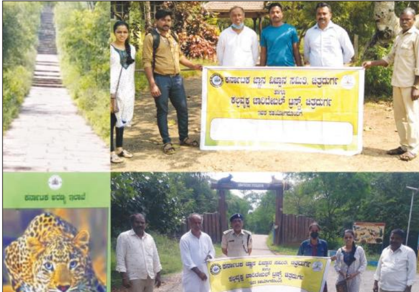
ಮಾರ್ಗೋಪಾಯಗಳನ್ನು ತಿಳಿದುಕೊಂಡಿರಬೇಕು ಎಂದು.

ಜೋಗಿಮಟ್ಟಿಗೆ ವೀಕ್ಷಣೆಗೆ ಬರುವ ಸಾಮಾನ್ಯ ಜನರಿಂದ ಹಿಡಿದು, ವಿದ್ಯಾರ್ಥಿಗಳಿಗೆ, ಮಕ್ಕಳಿಗೆ ಪರಿಸರದ ಬಗ್ಗೆ ಜ್ಞಾನ ಹೆಚ್ಚಿಸಲು, ಪರಿಸರದ ಬಗ್ಗೆ ಪ್ರೀತಿ, ಅಭಿಮಾನ ಮೂಡಿಸಲು ಸುಂದರವಾದ, ಪ್ರಕೃತಿಯ ಕೊಡುಗೆ ಜೋಗಿಮಟ್ಟಿ, ಲಕ್ಕಾಂತರ ವೈವಿಧ್ಯಮಯ ಜೀವಿಗಳನ್ನು ಗುರುತಿಸಿ, ಪೋಷಿಸಿ, ಸಂರಕ್ಷಿಸಿದಂತೆ ಅರಣ್ಯ ಅದನ್ನು ನಾವು ಬಹಳ ಎಚ್ಚರಿಕೆಯಿಂದ ಉಳಿಸಿಕೊಳ್ಳಬೇಕು. ಜೋಗಿಮಟ್ಟಿಗೆ ಪ್ರವೇಶ ಮಾಡುವ ವೀಕ್ಷಕರು, ಗಲಾಟೆ ಮಾಡದೆ, ಪರಿಸರಕ್ಕೆ ಹೊಂದಿಕೊಂಡಂತೆ ಜೀವನಶೈಲಿ ಅಳವಡಿಸಿಕೊಂಡು ಒಳಬರಬೇಕು. ಒಳ ಬರುವಾಗ ಕಿರುಜಾಡು ಬಿಡು, ಗಲಾಟೆ ಮಾಡುವುದು, ಶಬ್ದ ಮಾಡುವುದು, ಪ್ಯಾಸ್ಕಿ ಕಸವನ್ನು ಎಸೆಯುವುದು, ಎಲ್ಲೆಂದರಲ್ಲಿ ಬೆಂಕಿ ಹಾಕುವುದು ಮಾಡದಂತೆ, ಅವುಗಳನ್ನು ಸಂರಕ್ಷಿಸಿ ಕೊಳ್ಳುವಂತಹ