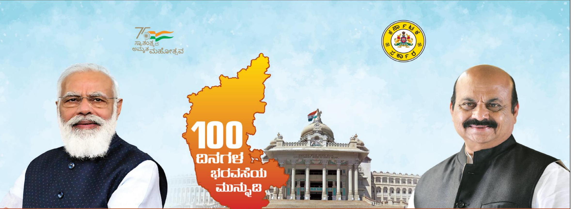
ಶ್ರೀ ನರೇಂದ್ರ ಮೋದಿ ಸನ್ಮಾನ್ಯ ಪ್ರಧಾನಮಂತ್ರಿಗಳು